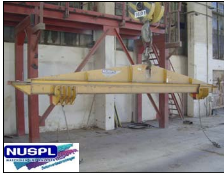
Traversen bis 25,0 to