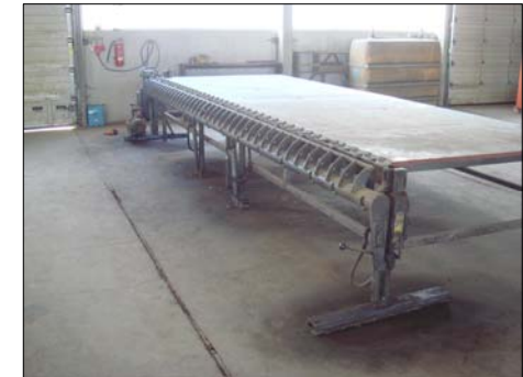
Mattenbiegemaschinen bis 6,0 m